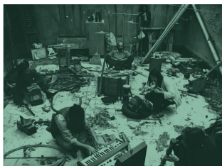
Hans Roels Street Music

Artistieke leiding Hans Roels • Artistieke ondersteuning Jasper Vanpaemel • Uitvoerders Creatief Atelier van het SLAC/Conservatorium, Collectief Publiek Geluid • Technische ondersteuning Provinciaal Domein Dommelhof • I.s.m. C-TAKT, Musica, Impulscentrum voor Muziek